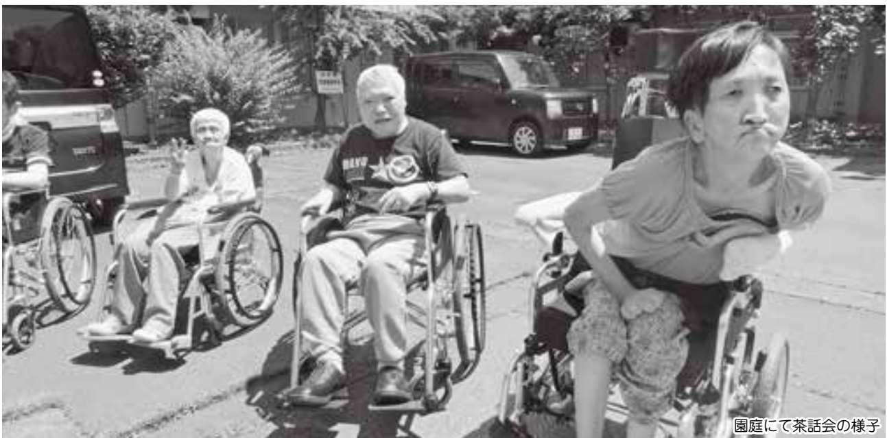
園庭にて茶話会の様子

専門職として、利用者一人ひとりに質の高いケアの提供ができる人 利用者、家族、地域の人々を尊重し思いやりをもって接することが出来る人 常に問題意識を持ち、積極的に改善を図ろうとする意欲を持つ人 協調、連携しながら相手の立場に立って行動する人