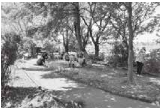
合同屋外環境整備