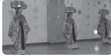
「ちゅらちむ うどうい しんか」による琉球舞踊