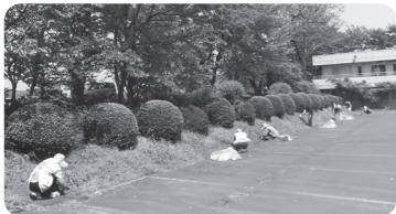
園周辺の草刈りや側溝掃除

4月の懇親会では18名、5月の屋外環境整備では19名の方々からご協力いただきました。当日参加していただいた皆様、ありがとうございました。