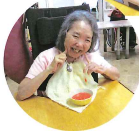
「スイカは美味しい」と喜ばれます。