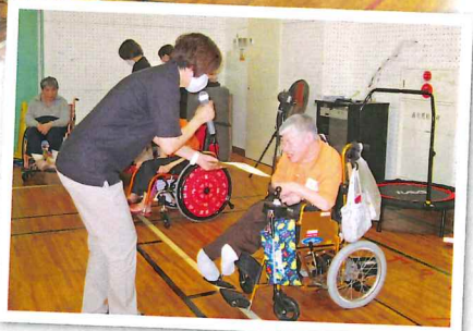
おもいっきり身体を動かして笑顔が良いです。