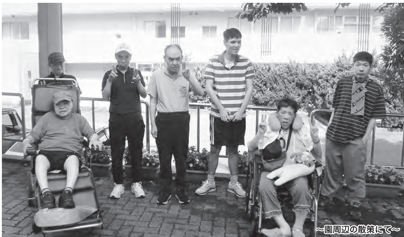
～園周辺の散策にて～