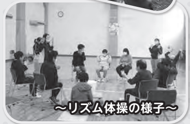
～リズム体操の様子～