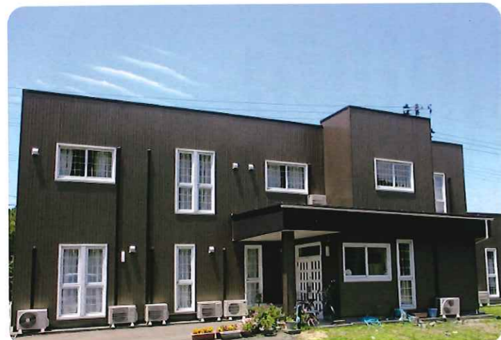
【新・グループホームいずもざき 外観】