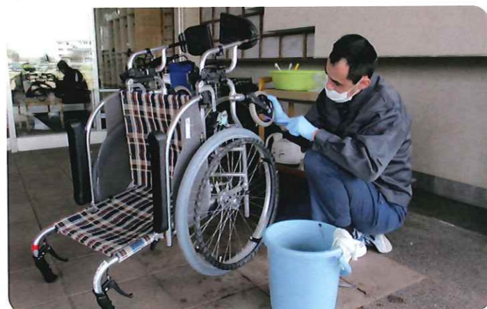
～1台1台丁寧に汚れを落としています～