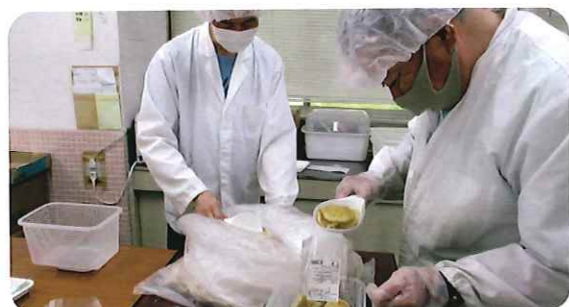
～分量を間違えないよう慎重に計量しながら袋詰めしています～

就労継続支援B型事業における受託作業のひとつである菓子分包作業では、利用者様が協力して種類別に分けたお菓子を注意しながら分包して出荷しております。