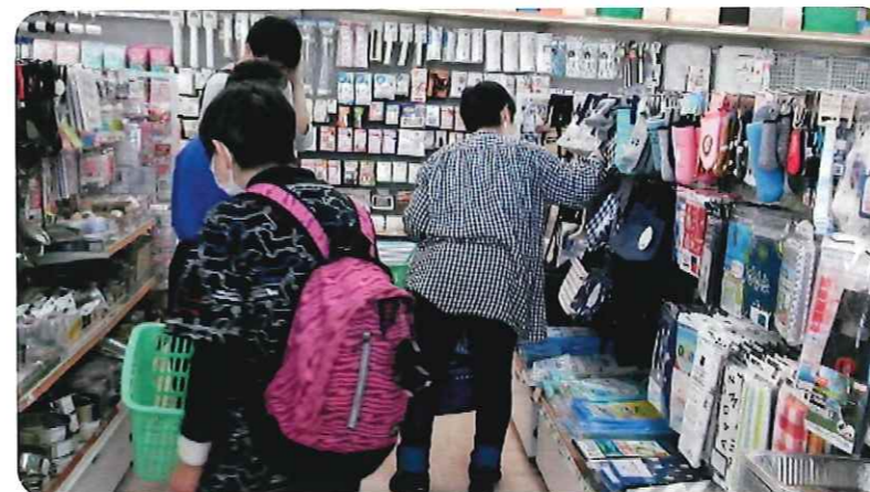
【100円均一も毎回人気の買い物スポットです】

久々の買い物や外食で利用者の皆様は大変楽しまれていました。今後も新型コロナウイルスの状況を注視しながら、少しずつ企画の頻度を以前に近づけていきたいものです。