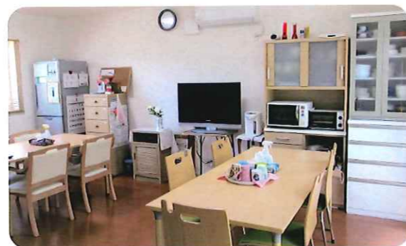
【ダイニングキッチン】